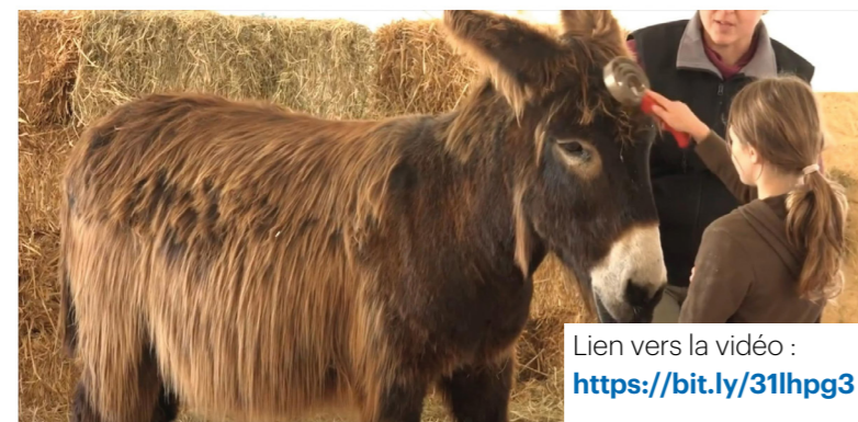
Lien vers la vidéo : https://bit.ly/31lhpg3

L'objectif pour les productrices et produc-