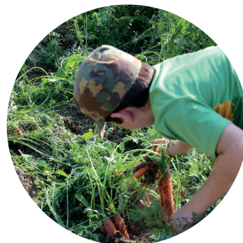
Photo : L'école à la ferme, c'est l'enseignement avec la tête, le cœur et les mains, qui offre aux enfants et aux jeunes un accès à l'origine de l'alimentation humaine.

Flyer sur l'agriculture pour les écoles : L'école à la ferme occupe une place de choix dans le Flyer d'AMS Écoles. En 2022, celui-ci a été envoyé à 120 000 adresses du groupe cible École sous forme d'encart dans des revues de formation en Suisse alémanique et en Suisse romande.