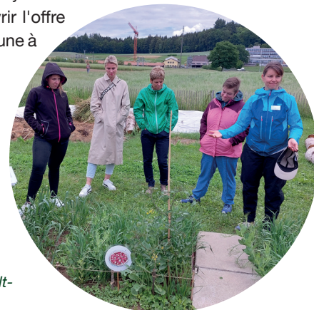
Image: De combien de terres arables une pizza a-t-elle besoin? Les responsables cantonaux EàF au Weltacker à Zollikofen.

International : en octobre, « une rencontre au sommet » a eu lieu dans le Tyrol avec des responsables de projets EàF issus de divers pays européens germanophones: Autriche, Allemagne, Italie (Tyrol du Sud), Principauté du Liechtenstein et Suisse. Ce fut l'occasion pour eux d'échanger sur leur mode respectif de gestion et leur système de financement autour des offres de fermes pédagogiques. La demi-journée EàF passée dans une ferme de montagne tyrolienne a permis de découvrir l'offre pédagogique commune à ces organisations.